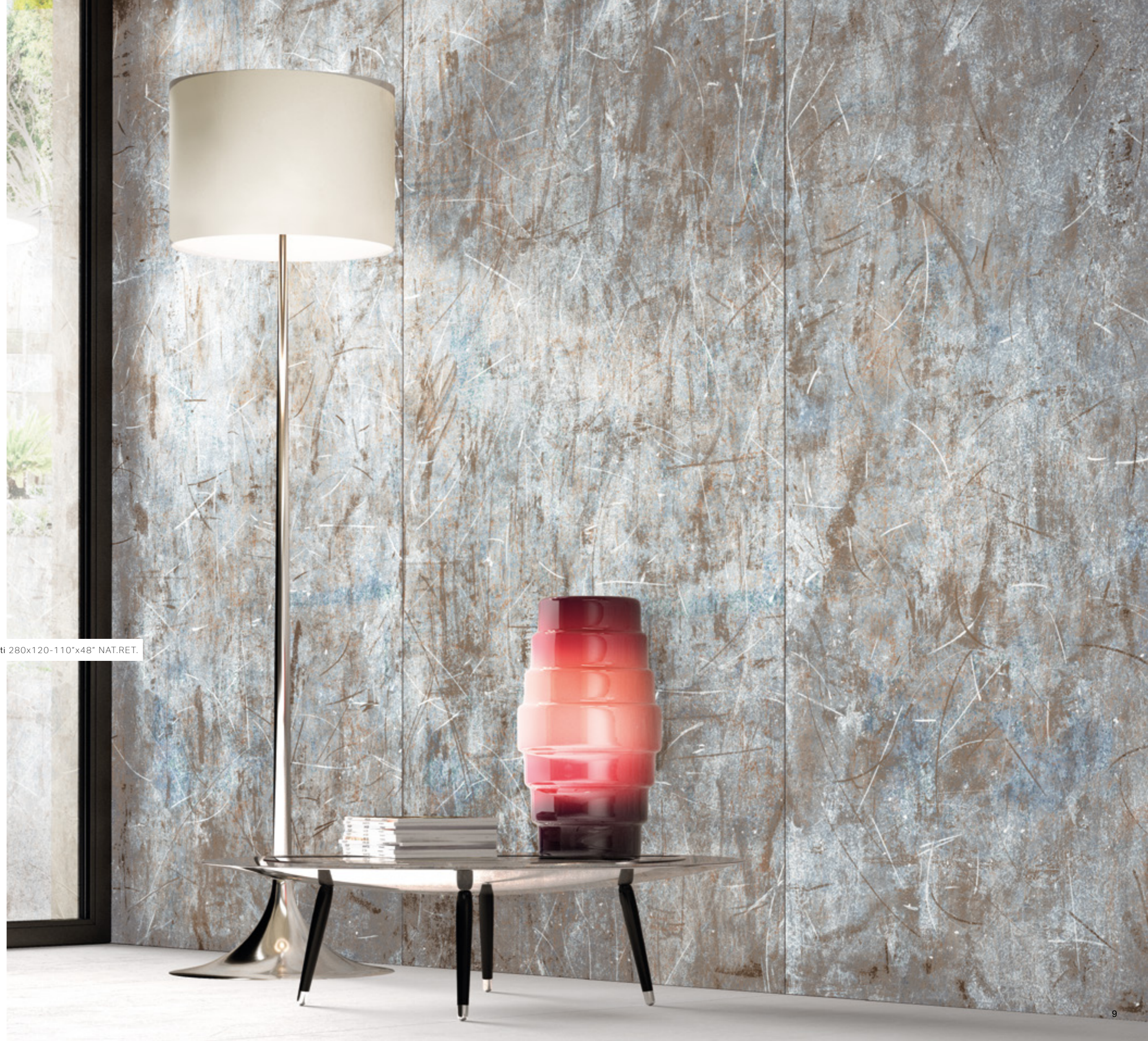
SCRATCH / light graffiti 280x120-110"x48" NAT.RET.