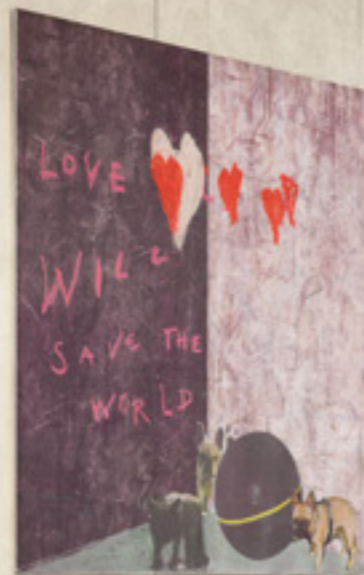
SCRATCH / floor: eclipse 160x160-63"x63" NAT.RET. - wall: mitkyway 320x160-126"x63" NAT.RET.