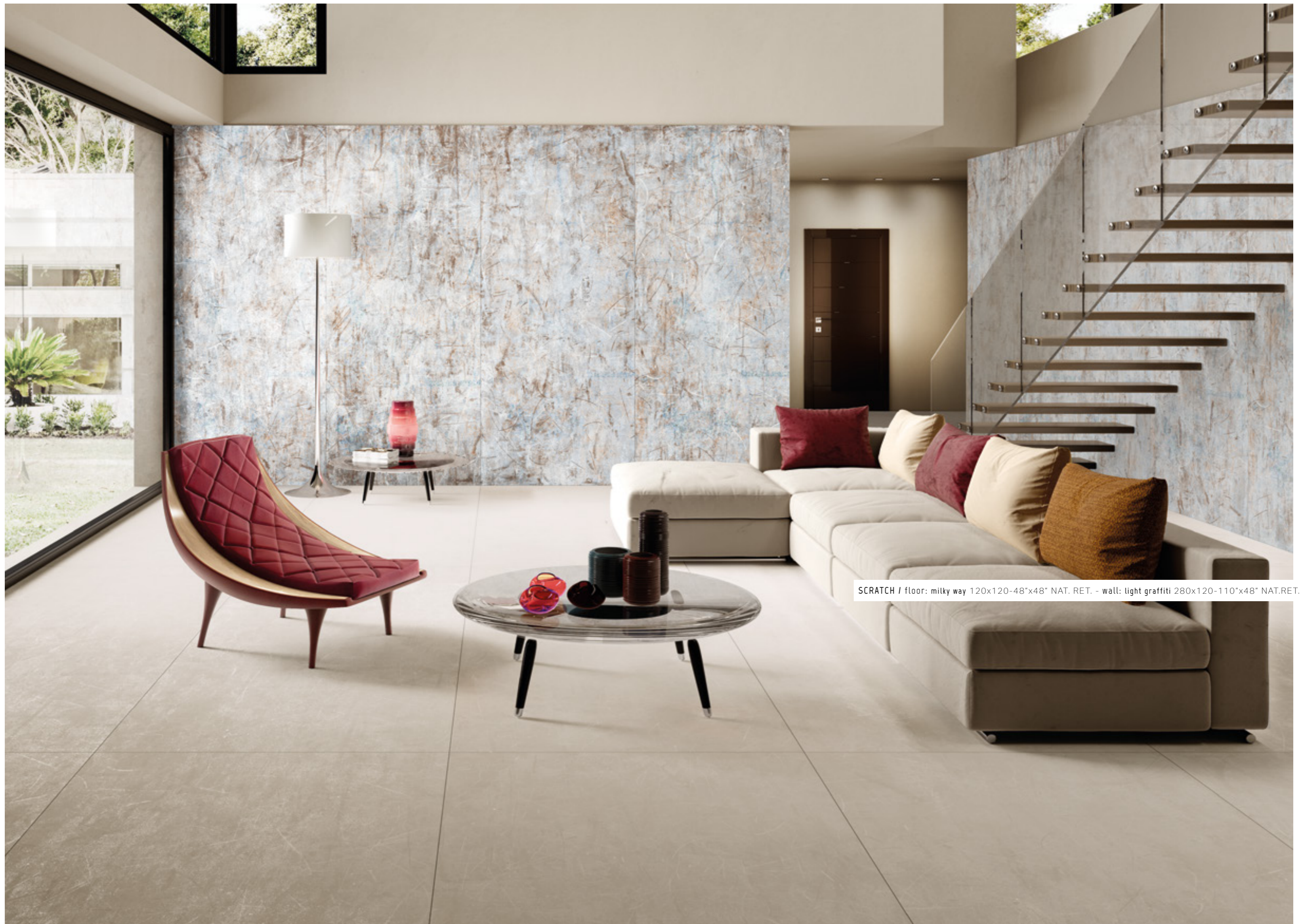
SCRATCH / floor: milky way 120x120-48"x48" NAT. RET. - wall: light graffiti 280x120-110"x48" NAT.RET.