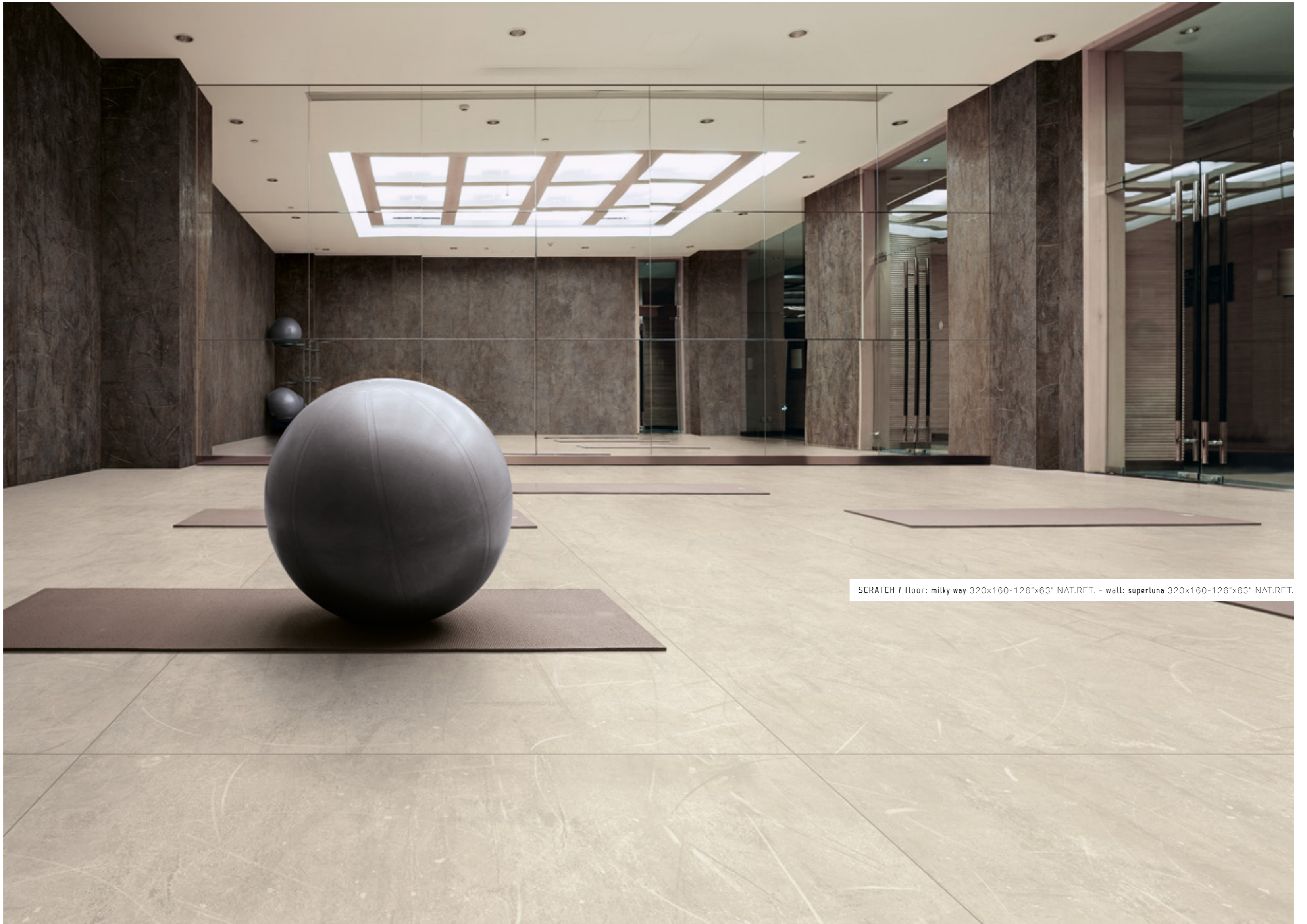
SCRATCH / floor: milky way 320x160-126"x63" NAT.RET. - wall: supertuna 320x160-126"x63" NAT.RET.