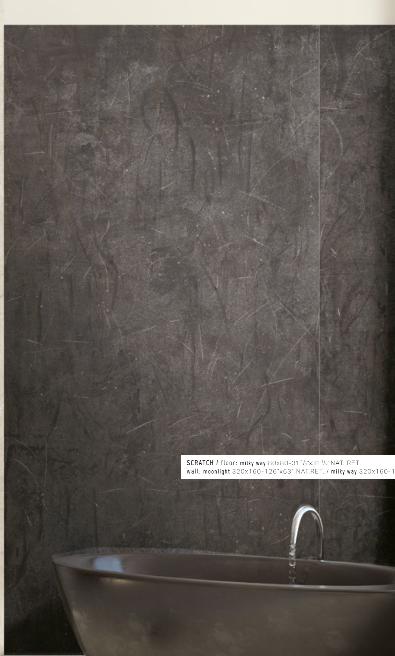
SCRATCH / floor: milky way 80x80-31 1/2"x31 1/2" NAT. RET. wall: moonlight 320x160-126"x63" NAT.RET. / milky way 320x160-126"x63" NAT.RET.