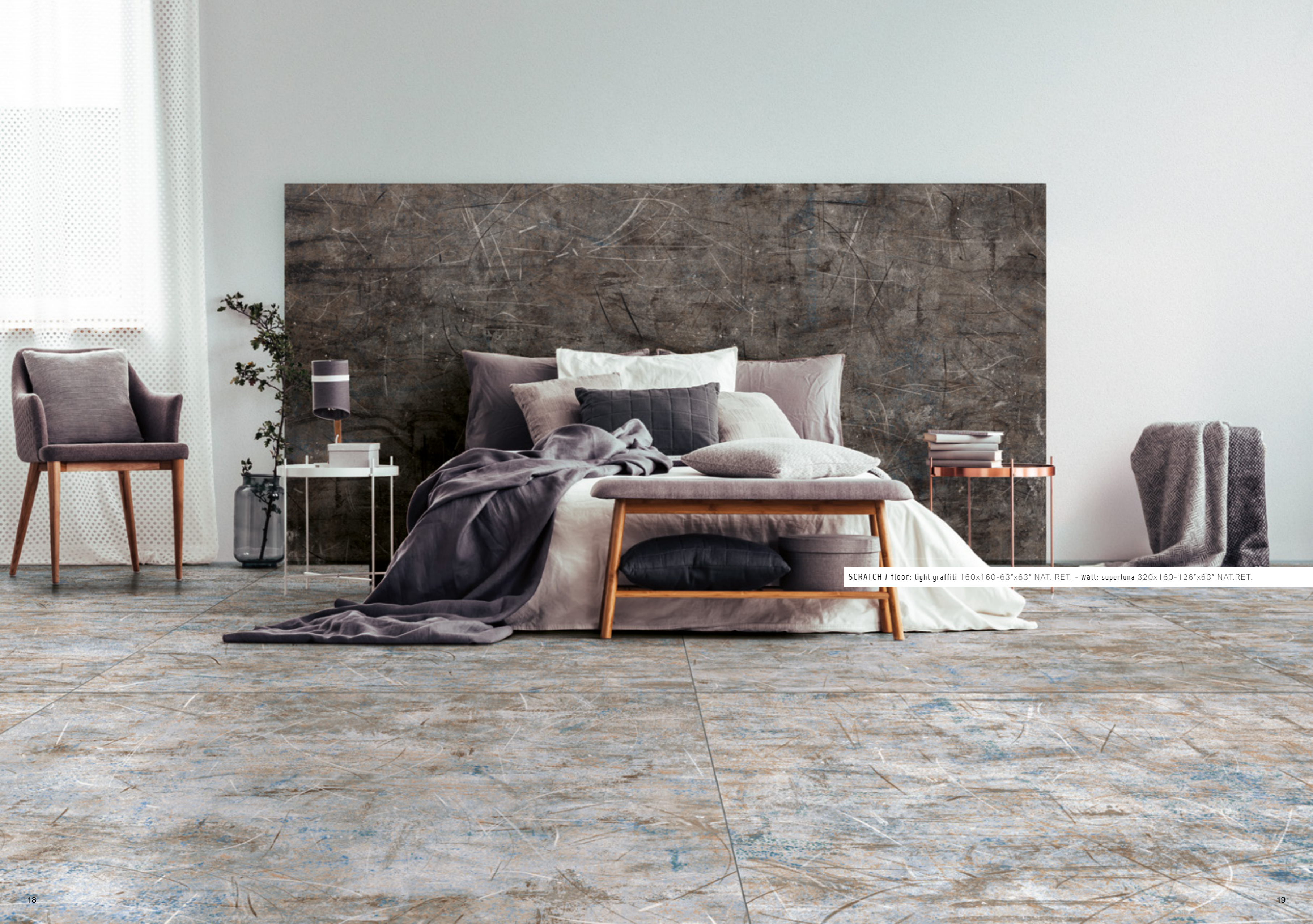
SCRATCH / floor: light graffiti 160x160-63"x63" NAT. RET. - wall: supertuna 320x160-126"x63" NAT.RET.