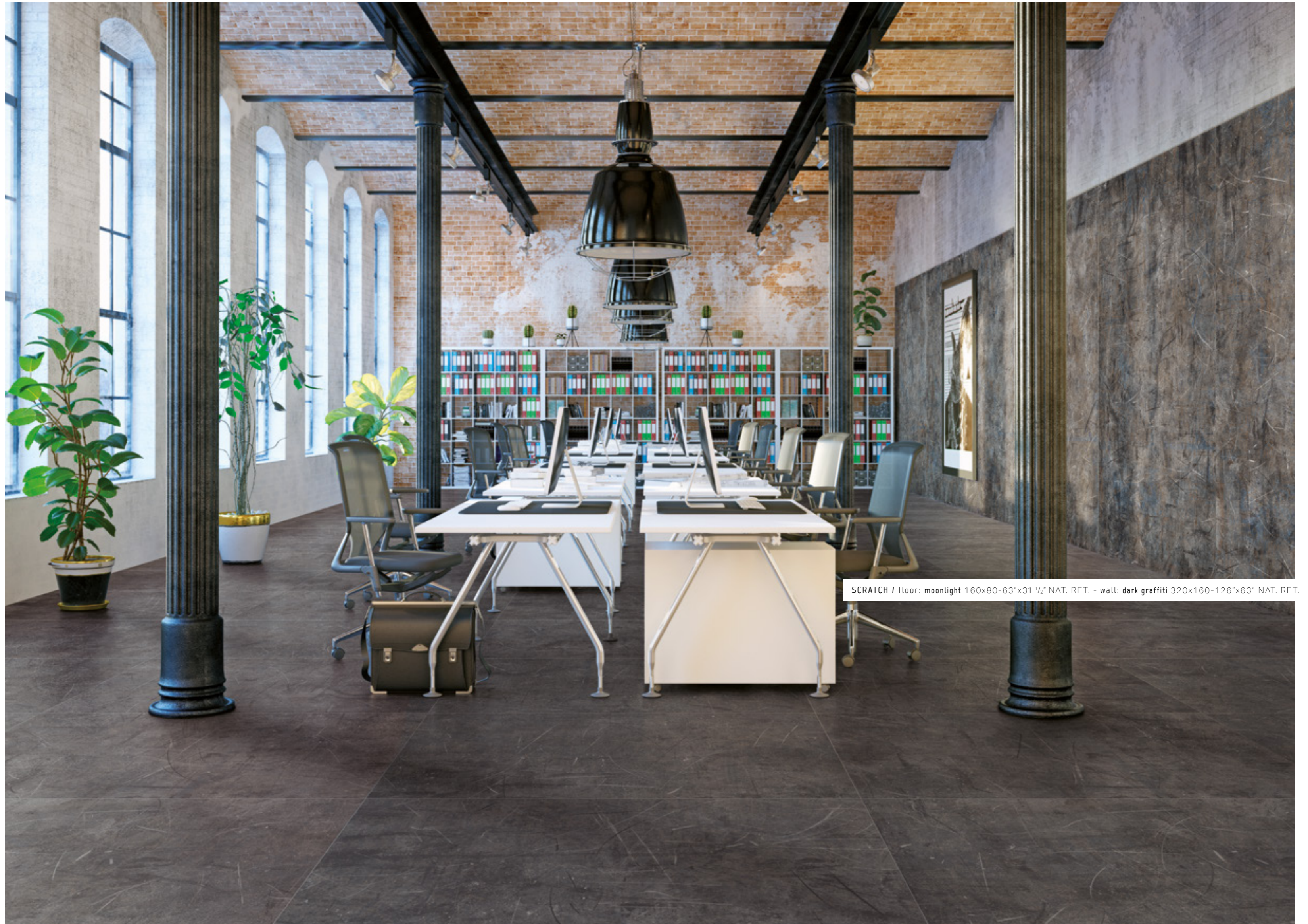
SCRATCH / floor: moonlight 160x80-63"x31 1/2" NAT. RET. - wall: dark graffiti 320x160-126"x63" NAT. RET.