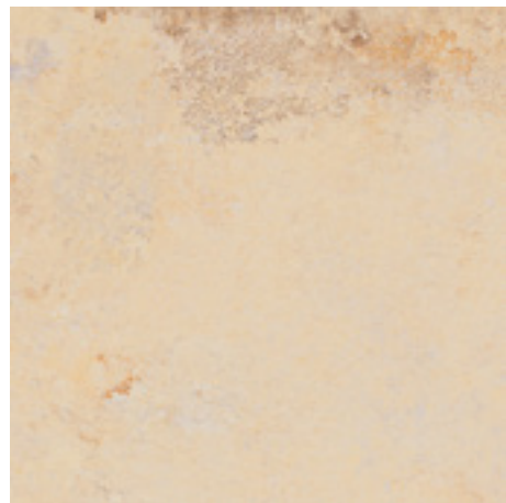
122005 Gold 60x60 . 24"x24" Nat Ret