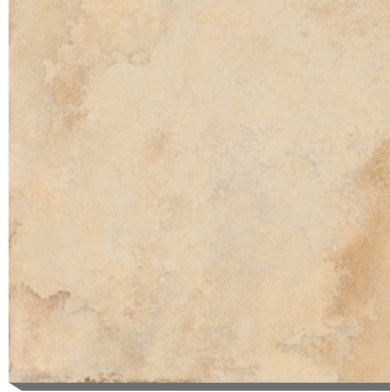
122013 Gold 100x100 . 40"x40" Nat Ret