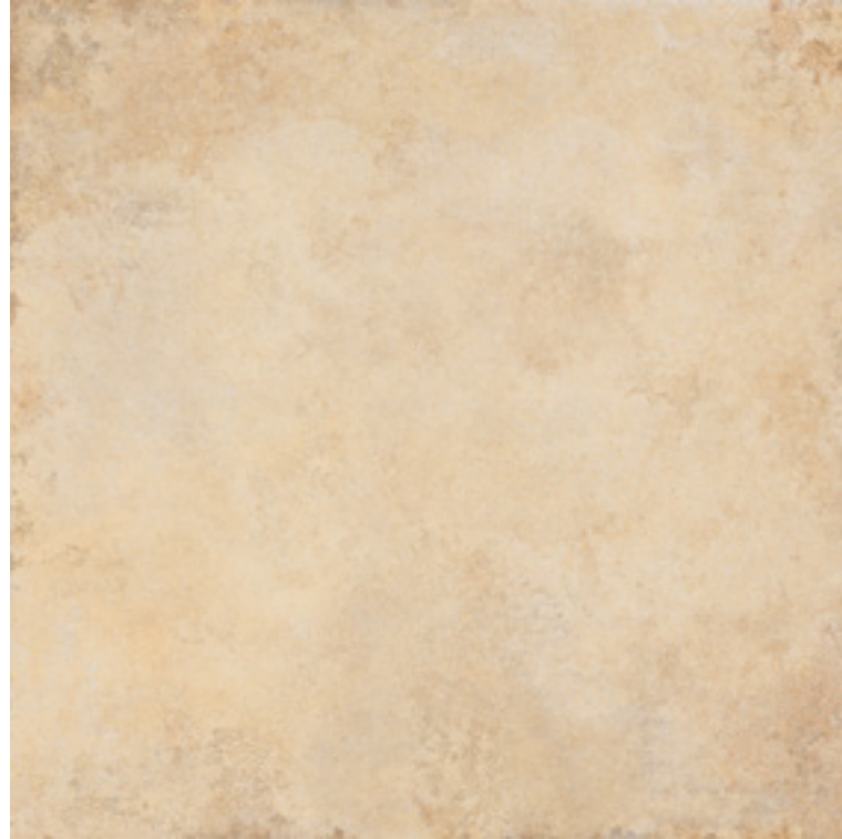
122012 Gold 100x100 . 40"x40" Nat Ret