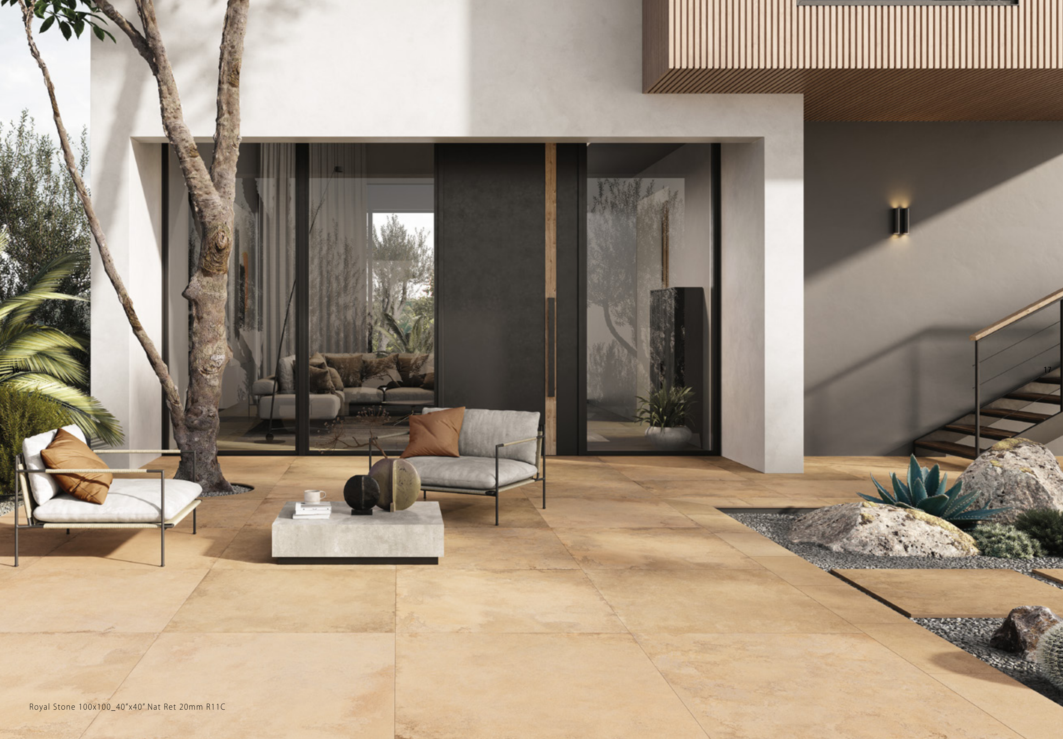
Royal Stone 100x100_40"x40" Nat Ret 20mm R11C