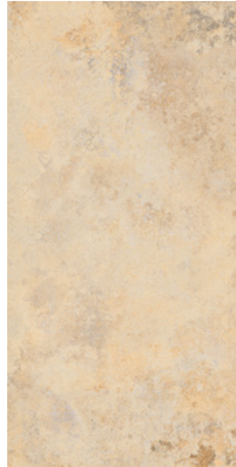
122001 Gold 60x120 . 24"x48" Nat Ret