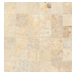
122015 Mosaico Gold 30x30 . 12"x12" Nat Ret